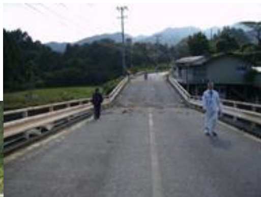
●橋梁も、3路線3ヶ所で被害