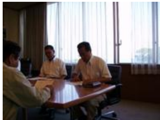
▲古川町長から被害の概要説明