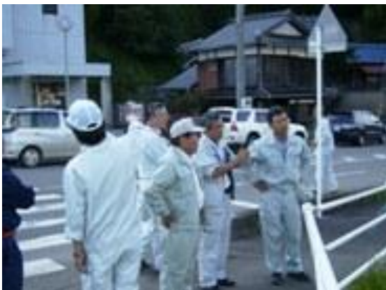
▼熊野川に注ぐ相野谷川の鮎田水門にて