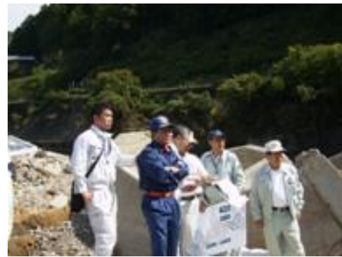
▲河川堤防の崩壊現場