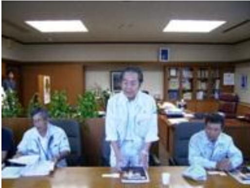
▼紀宝町役場を訪問

紀宝町では、熊野川や支流の相野谷川が氾濫し、濁流が集落を飲み込み、広範囲で人家が水没しました。