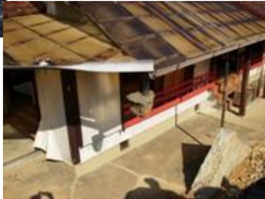
▼尾呂志川の決壊により被害を受けた神社

〔土木・農林水産関係施設被害状況〕 被害金額 1,346,055 千円超 (調査中のものを除く。)