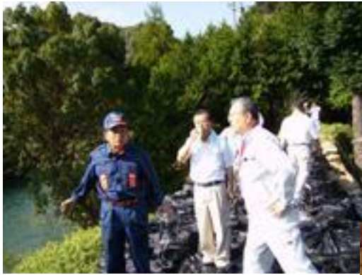
▲決壊箇所を応急補修した堤防上