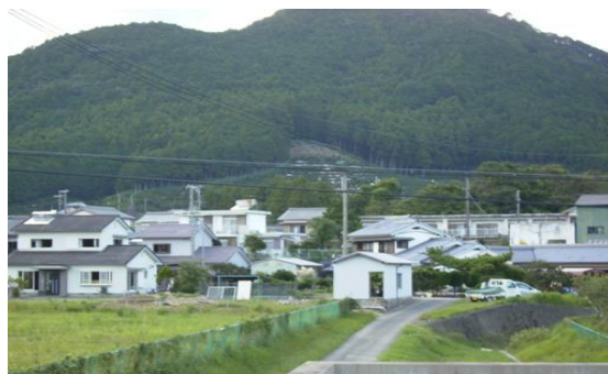
▼住家の2階部分まで浸水した▼