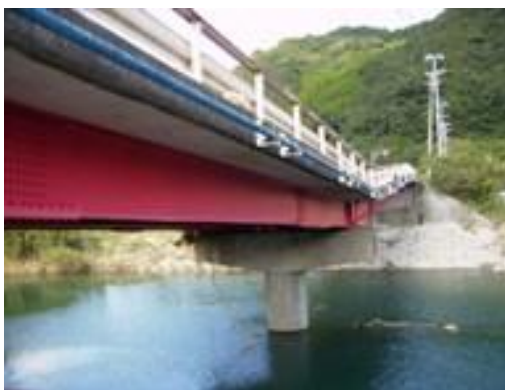
▼2級河川尾呂志川橋梁