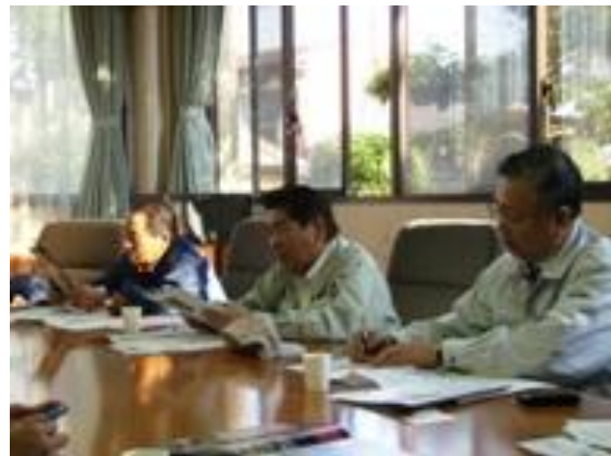
▼西田町長から被害状況の説明